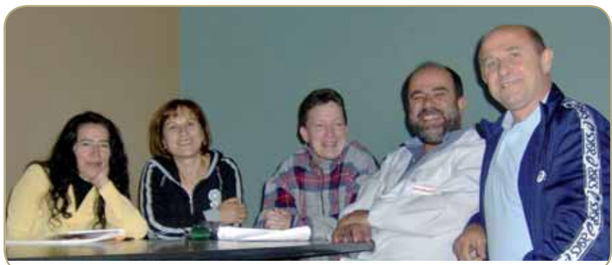
Ambato Ecuador. Con i responsabili del progetto di assistenza sanitaria ai bambini.