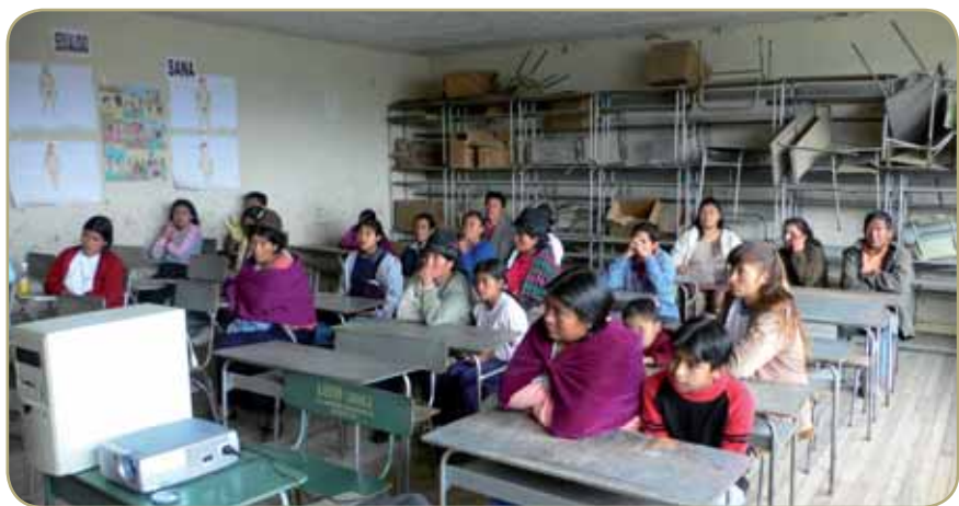
Corso di sensibilizzazione per i genitori delle scuole dei barrios (quartieri) di Ambato

Attraverso il nostro viaggio abbiamo potuto verificare di persona la serietà della Fondazione Alli Causai che realizza il progetto; siamo con loro, li incoraggiamo a proseguire perché anche ai bambini dell'Ecuador sia garantita una "vita nuova, buona e completa" come afferma il nome "Alli Causai". E' un loro diritto e grazie alle famiglie dell'Afi diventa realtà.